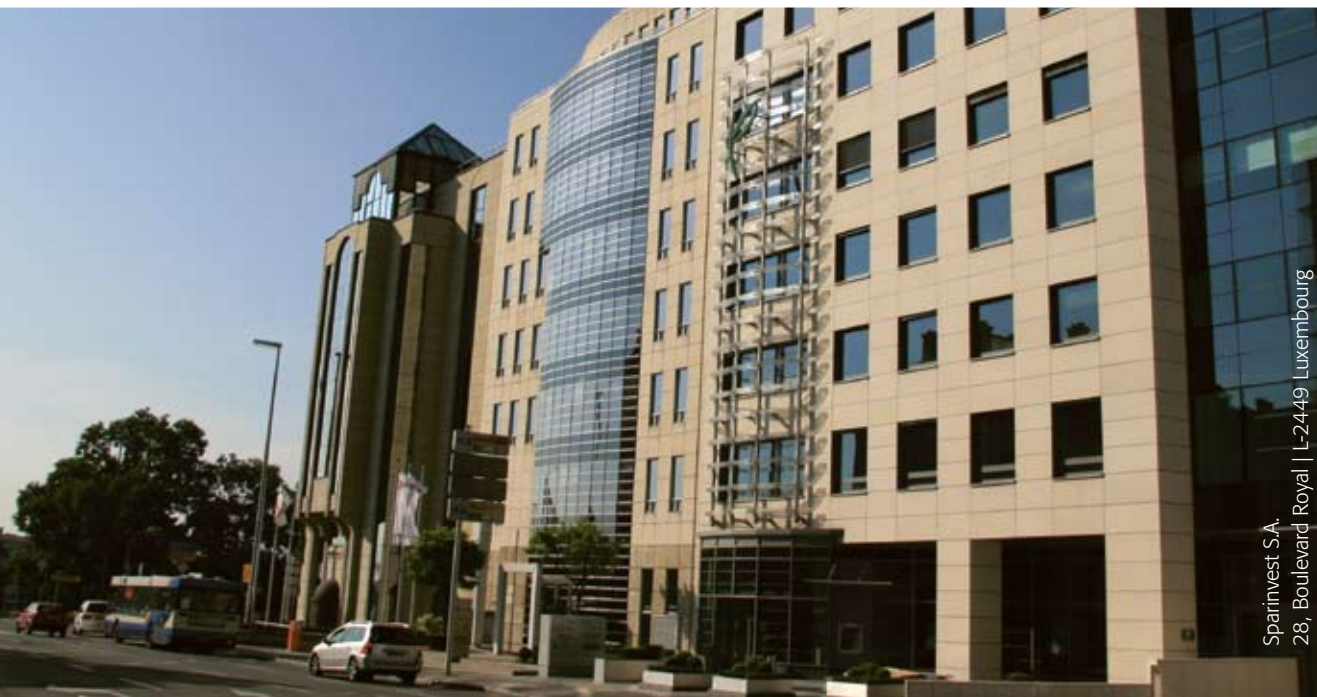
Sparinvest S.A. 28, Boulevard Royal | L-2449 Luxembourg

Investeringsforeningen Sparinvest S.A., Luxembourg anvender den anerkendte RBC Dexia Investor Services Bank, Luxembourg som lokal administrator og depotbank. Foreningen er rådgivet af Sparinvest Fondsmæglerselskab A/S, som er et 100 % ejet datterselskab af Sparinvest i Danmark. Handel med investeringsbeviserne fra Investeringsforeningen Sparinvest S.A., Luxembourg foregår helt normalt som ved investering i danske investeringsbeviser. Investeringsbeviserne er dog i Euro.